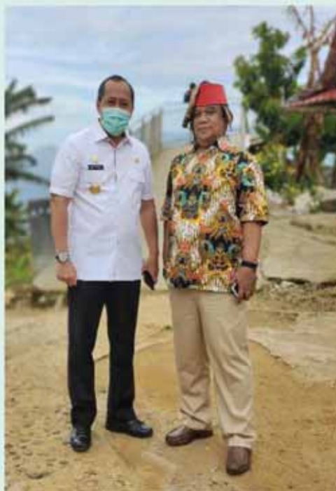
Inspektur V Itjen Kementerian ESDM dengan Bupati Toraja pelaksanaan Pengawasan Terpadu TA 2020.