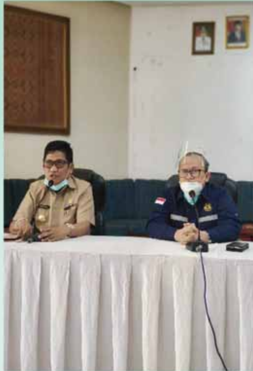
Koordinasi Infrastruktur ESDM di Kabupaten Toraja Utara.

e. Langkah – langkah perbaikan yang perlu dilakukan dari hasil pengawasan terpadu adalah: