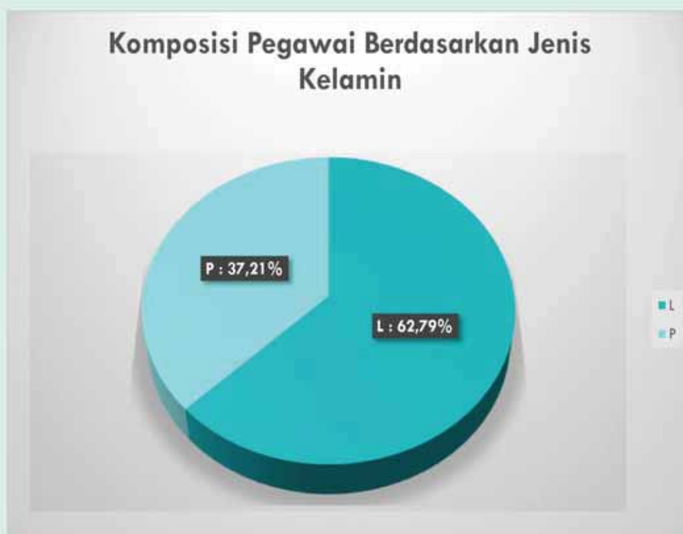
Gambar 1.3. Komposisi Pegawai Berdasarkan Jenis Kelamin