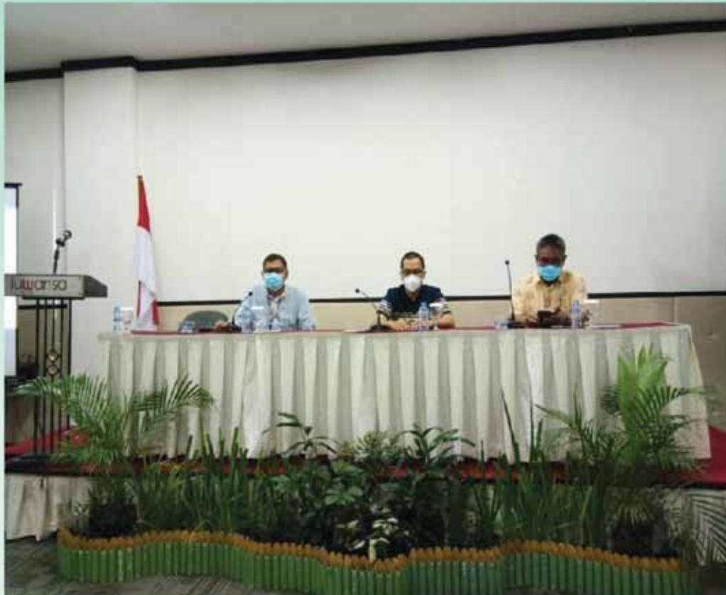
Koordinasi Pengawasan Terpadu Inspektorat II atas Sumur Bor Air Bersih TA 2020 di Kelurahan Kalampangan, Kecamatan Sebangau, Kota Palangkaraya Provinsi Kalimantan Tengah