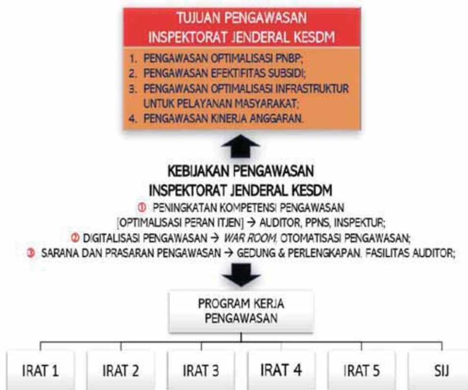
Gambar 1.1. Kebijakan Pengawasan Inspektorat Jenderal KESDM