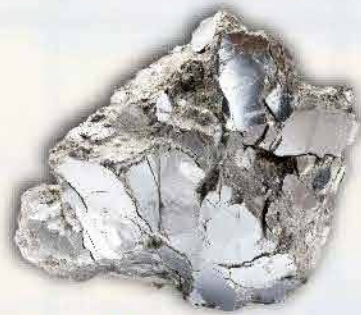
Perak 210 ton/tahun