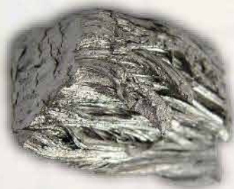
Paladium 0,375 ton/tahun