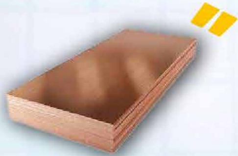
Katoda Tembaga 600.000 ton/tahun