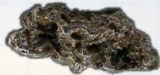
Platinum 0,03 ton/tahun