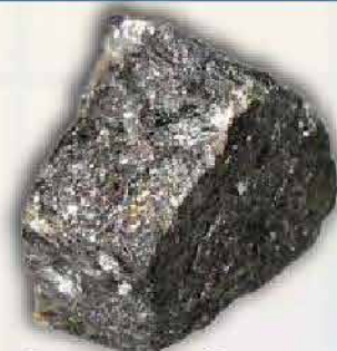
Selenium 285 ton/tahun