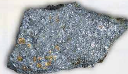
Paladium 2200 ton/tahun