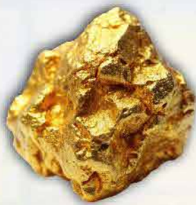
Emas 50 ton/tahun